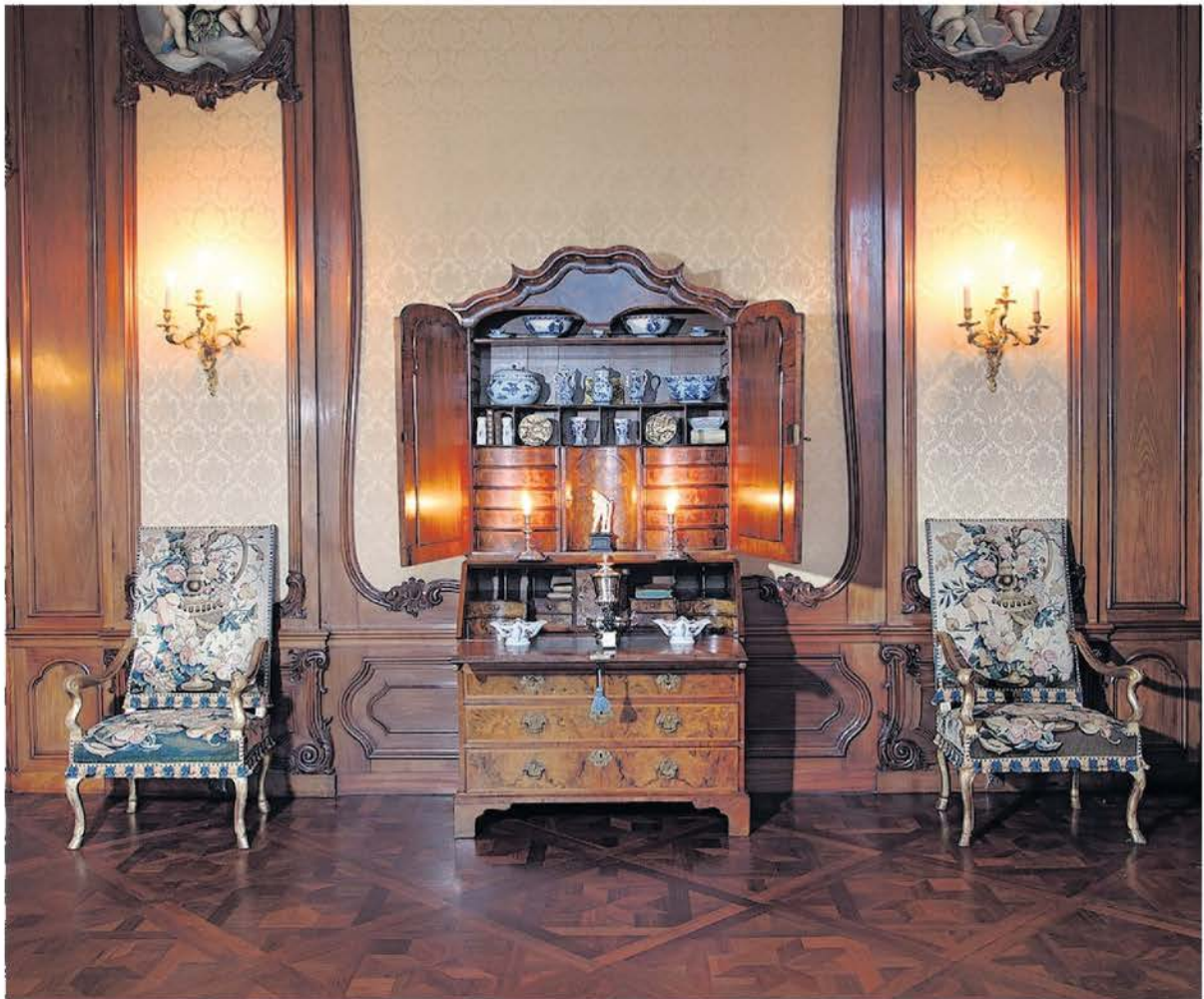
Gustav Leonhardt voegde uiteenlopende voorwerpen samen tot een geloofwaardige collectie.